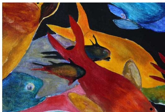
Détails de la peinture "Aquarium 1" (toute de grande toile de 7 mètres x 1 mètre) de Dominique Lestel.